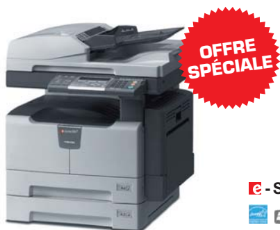
e - STUDIO 167